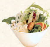
国産健康野菜盛り* ผักญี่ปุ่นนานาชนิด