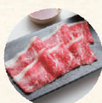
好きなお肉 เนื้อ