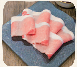
国産豚(Sサイズ) หมูบ้าน (เล็ก)