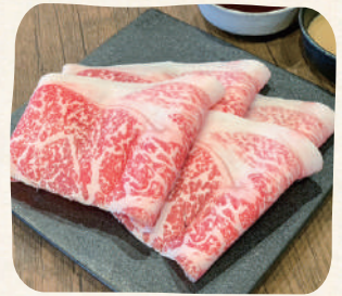
国産牛(Sサイズ) เนื้อในประเทศ (เล็ก)