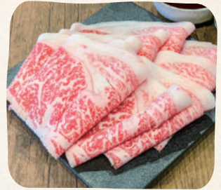
国産牛(Mサイズ) เนื้อในประเทศ (ขนาดกลาง)