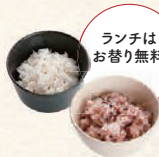
白米 or 十五穀米 ข้าวหรือข้าวหลายเมล็ด *เติมฟรีสำหรับมื้อกลางวัน