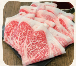
国産牛(Lサイズ) เนื้อในประเทศ (ใหญ่)