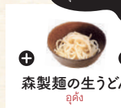
森製麺の生うどん うどん