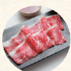
好きなお肉 เนื้อ