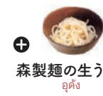
森製麺の生うどん うどん