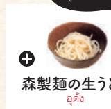
森製麺の生うどん うどん