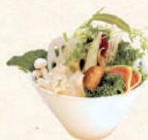
国産健康野菜盛り* ผักญี่ปุ่นนานาชนิด