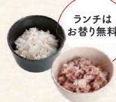
白米 or 十五穀米 白米饭 or 杂粮饭 午餐是免费续杯