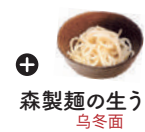
森製麺の生うどん 乌冬面