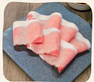
国産豚(Sサイズ) 上选 国产猪肉 (Small)