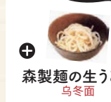
森製麺の生うどん 乌冬面