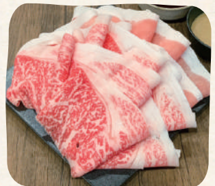
牛&豚(Lサイズ) 国产牛肉 × 上选 国产猪肉 (Large)