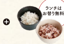
白米 or 十五穀米 Rice or Multi-Grain Rice. *Free refills for lunch