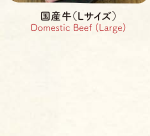
国産牛(Lサイズ) Domestic Beef (Large)