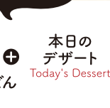
本日の デザート Today's Dessert