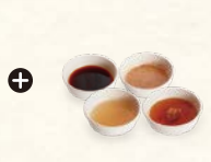
選べるつけだれ Dipping Sauce