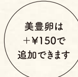
美豊卵は +¥150で 追加できます

※国産健康野菜盛りは季節によって内容が変わります。(白菜、ケール、トレビス、白しめじ、豆腐、くずきりなど、15種類以上)