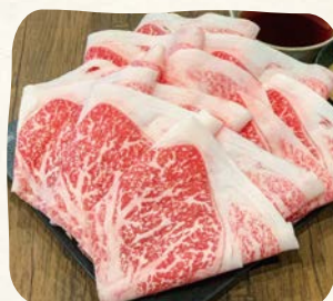
国産牛(Mサイズ) Domestic Beef (Medium)