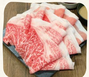
牛&豚(Lサイズ) Beef & Pork (Large)