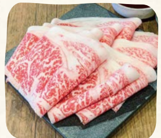
国産牛(Mサイズ) Domestic Beef (Medium)