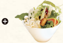
国産健康野菜盛り* Japanese Domestic Vegetable Platter