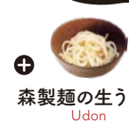
森製麺の生うどん Udon