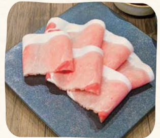
国産豚(Sサイズ) Domestic Pork (Small)