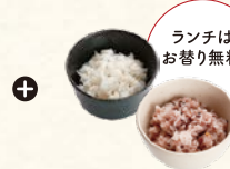
白米 or 十五穀米 Rice or Multi-Grain Rice. *Free refills for lunch