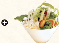
国産健康野菜盛り* Japanese Domestic Vegetable Platter