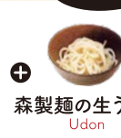
森製麺の生うどん Udon