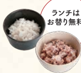
白米 or 十五穀米 흰쌀밥 or 잡곡밥 점심은대체 무료