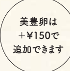
美豊卵は +¥150で 追加できます