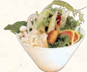
国産健康野菜盛り* 국산 야채모듬