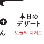
本日の デザート 오늘의 디저트