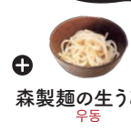
森製麺の生うどん 우동