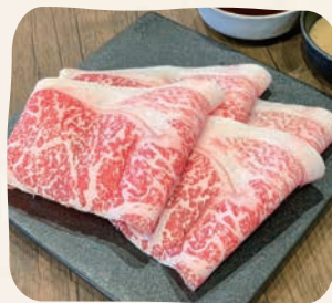
国産牛(Sサイズ) 国産牛肉 (Small)