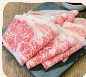
国産牛(Mサイズ) 国産牛肉 (Medium)