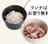
白米 or 十五穀米 白米饭 or 杂粮饭 午餐是免费续杯