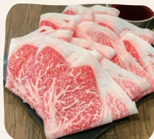
国産牛(Lサイズ) 国産牛肉 (Large)