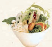
国産健康野菜盛り* 国产蔬菜拼盘