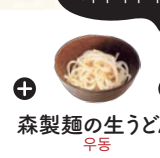
森製麺の生うどん 우동