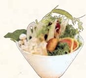
国産健康野菜盛り* 국산 야채모듬