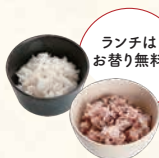
白米 or 十五穀米 흰쌀밥 or 잡곡밥 점심은대체 무료