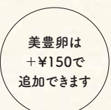
美豊卵は +¥150で 追加できます