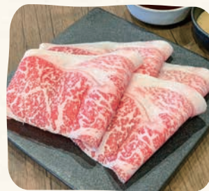
国産牛(Sサイズ) 국산 소고기(Small)