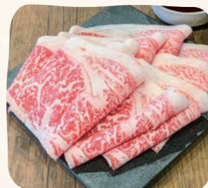
国産牛(Mサイズ) 국산 소고기(Medium)